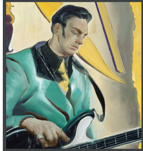
Neo Rauch, Rauch , 2005

«You don't have to understand them, just to feel that this creation, to the greatest possible extent, is at peace with itself», The Word Magazine