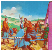
Neo Rauch, Die Kontrolle , 2010

Découvrez la première exposition belge consacrée exclusivement à l'un des peintres allemands les plus influents du moment. Une nouvelle forme de peinture, le plus souvent sur des grands formats, qui emprunte des éléments au réalisme social, au surréalisme, au langage visuel des bandes dessinées et à l'histoire récente. Plongez-vous dans cet univers fascinant ! Plus d'info