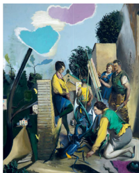
Neo Rauch, Nest , 2012

Ontdek de eerste solotentoonstelling in België van een van Duitslands toonaangevende schilders van het ogenblik. Een nieuw soort schilderkunst, meestal grote formaten, die elementen van het sociaal realisme, surrealisme, de beeldtaal van strips en de recente geschiedenis samenbalt. Laat jezelf verrassen door deze fascinerende wereld ! Meer info